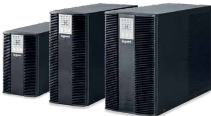
3 101 54